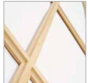
profil ramki VITTORIA-W