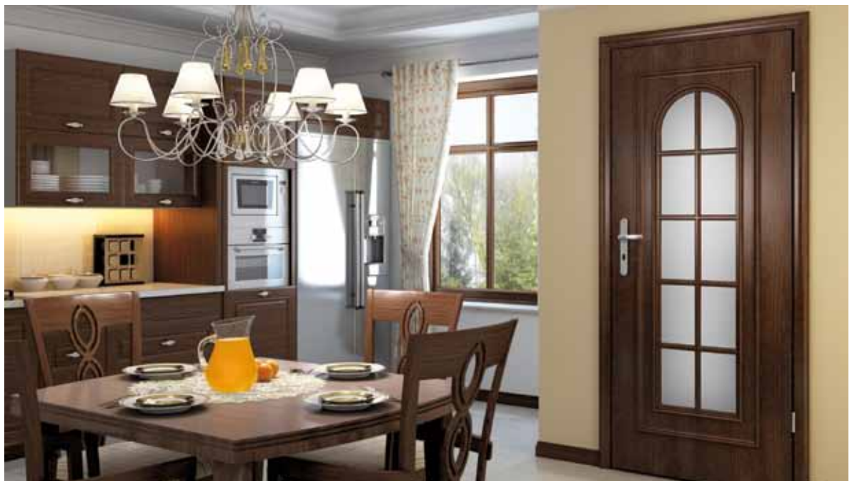
drzwi VITTORIA-W, wzór 01S10, ościeznica regulowana SYSTEM DIN