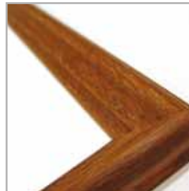
profil listwy wystroju VITTORIA-W

Drzwi zbudowane są z ramiaka drewnianego obłożonego dwiema gładkimi płytami HDF pokrytymi okleiną naturalną. Układ usłojenia ramiaka oraz frezowanych płycin jest pionowy. Standardowe wypełnienie stanowi warstwa o strukturze „plastra miodu”.