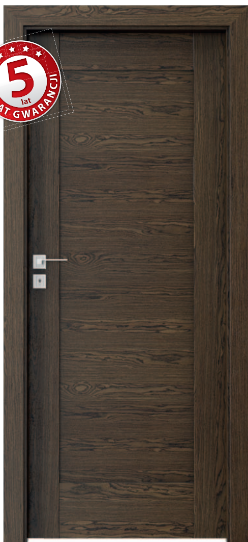
Natura TREND B.0, Wenge