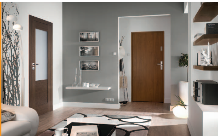
Natura TREND B.3, Wenge

Wyrafinowana forma kolekcji Natura TREND, przeznaczona jest dla tych, co cenią sobie nowoczesne rozwiązania z charakterem.