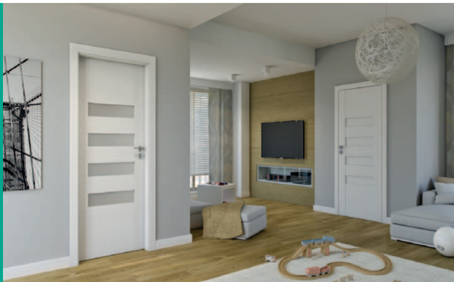
Porta KONCEPT H.4, H.0, Biały

Drzwi z kolekcji Porta KONCEPT odpowiadają najnowszemu trendom we wzornictwie użytkowym. Drzwi w których elementy drewniane odgrywają dominującą rolę w konstrukcji skrzydła.