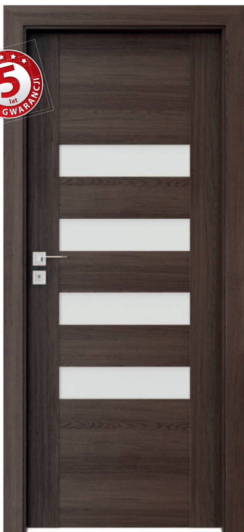
Porta KONCEPT H.4, Dąb Hawana